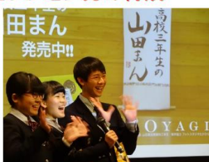
四国コンテンツ映像フェスタ2017 CMプレゼンの様子