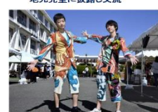
文化祭で「フリップメーカーズ」を着て学習活動の内容を披露