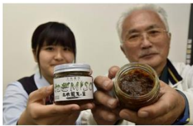
◎高知県香美市産の青ねぎを使ったおかずみそ「土佐香味 ねぎMISO」