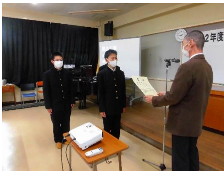
橋本部会長から表彰状授与