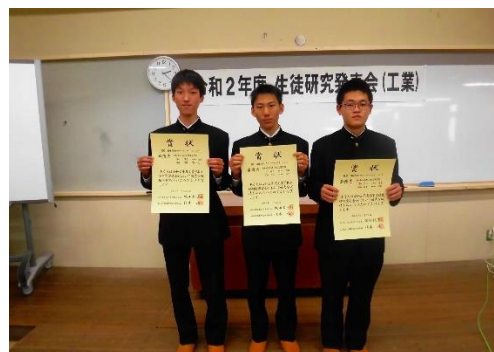
最優秀賞の高知工業高校チーム 「植物色素とカラーアルマイトについて」