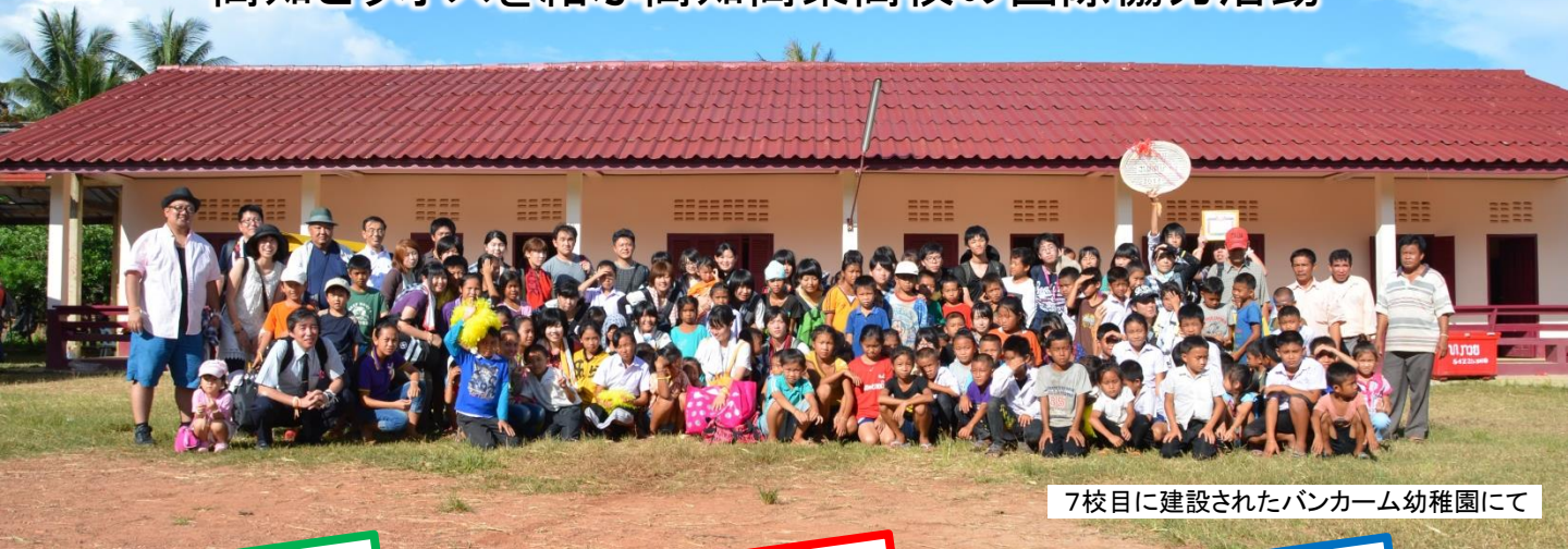
7校目に建設されたバンカーム幼稚園にて