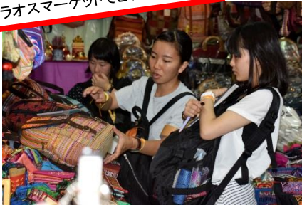
■マーケティングを活かし国際ビジネスに挑戦