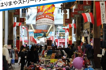
■高知とラオスを結ぶ商店街共催イベント

高知商業高等学校は、自主自治を掲げる生徒会を主体として、平成6年からラオスに学校を贈る国際協力活動を継続し、今までに8校の学校建設に協力しています。この活動は、商業高校の特性を生かし、校内に模擬株式会社を設立し、生徒・教職員・保護者が株主となって出資します。次に、毎年生徒代表がラオスを訪問し、伝統商品を買付けて高知で販売します。そして1年間の活動として、出資金を株主に返還し、得られた利益を高知ラオス会に学校建設活動寄付金として贈呈しています。