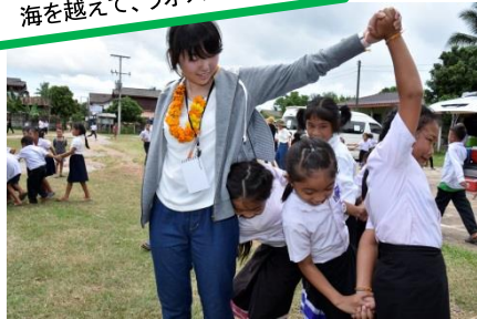
■3校目に建設されたバンカーム小学校との交流