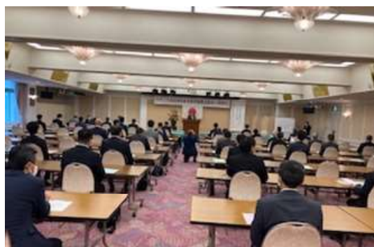
会場全体後方から