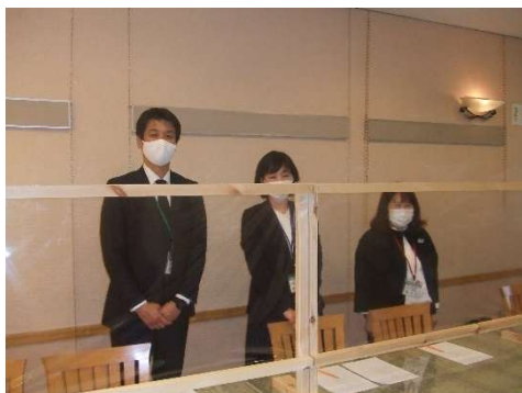
受付では検温チェックなども