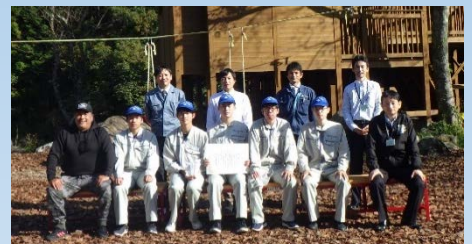
感謝状を頂きました。