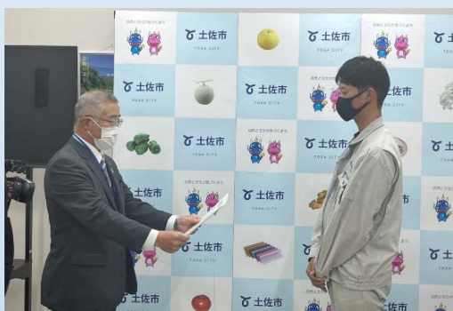
感謝状を頂きました

・12月17日、土佐市の大西前公園4基、市民公園2基、甫淵公園2基のベンチを寄贈しました。寄贈に先立ち土佐市役所にて寄贈式が行われ、土佐市長より感謝状を頂きました。