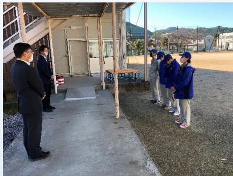
校長先生、教頭先生へ受け渡し

・12月3日、土佐市戸波中学校へベンチを3基寄贈しました。休日には地域の方々が参加するイベントがあるとの事で休憩所として活用して頂きます。