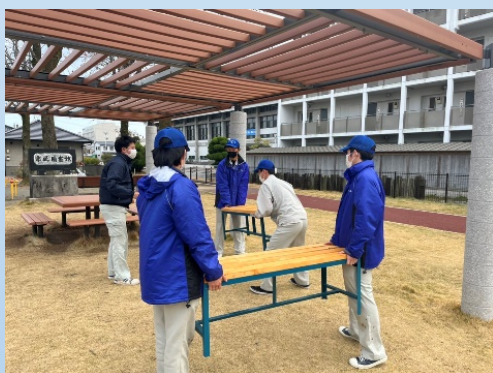
大西前公園に設置