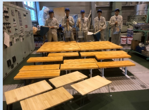
販売用に制作したベンチ

・11月19日、4年前に宇佐小学校へ寄贈したベンチを1基補修しました。座面の木材部分の張替え、再塗装を行い。再度グラウンドへ設置しました。先輩たちの思いと、寄贈先で大事に使われている事を感じながら作業を行いました。