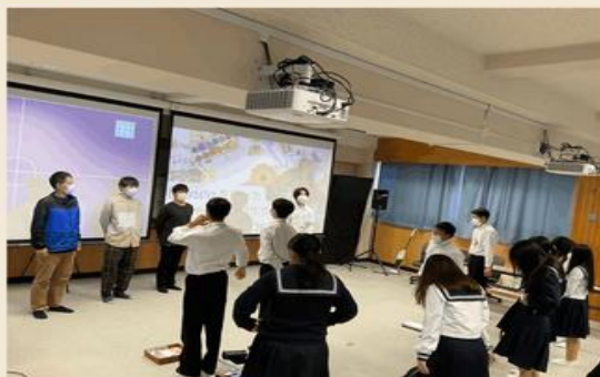
講師の方々の紹介の様子