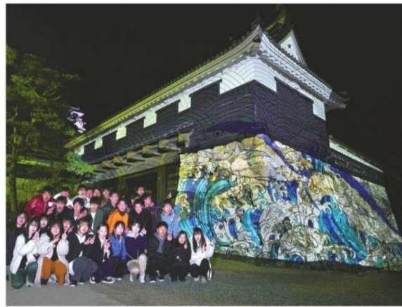
高知商業高校の生徒が制作したアート映像。高知城追手門でロジエーションマッピングが行われる高知市丸の内(11日)

高知商業高校情報マネジメント科1年生33人が12日午後6時半〜8時、高知城追手門に自ら制作したアート映像のプロジェクト映像「高知の魅力」を約20分の作品に詰め込んでお披露出する。