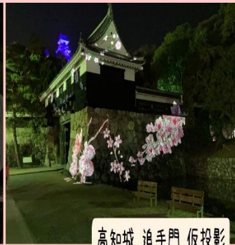
高知城 追手門 仮投影