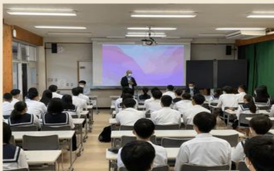
校長先生からプロジェクトの説明を受ける様子